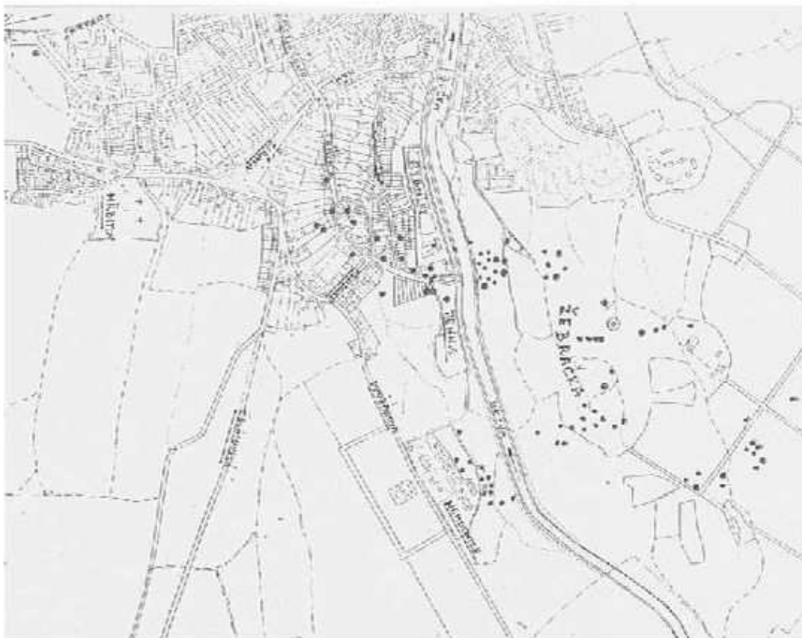
BOMBARDOVÁNÍ. Mapka Přerova s černě vyznačenými místy, kde v listopadu 1944 dopadly spojenecké bomby.