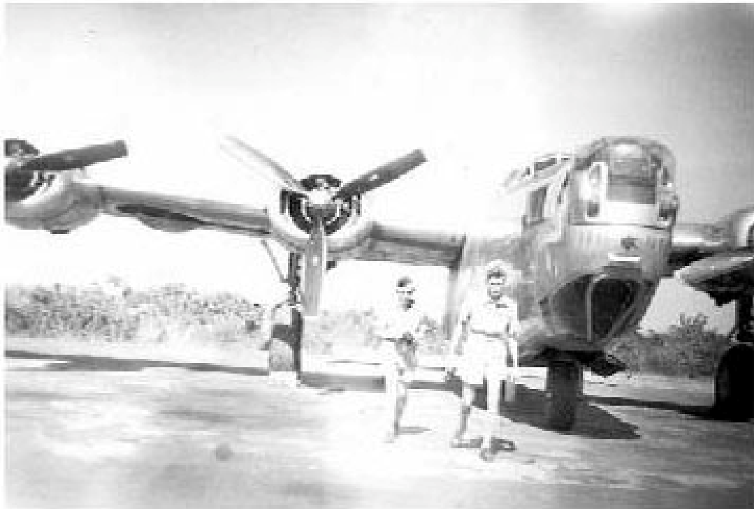
PŘINESLY ZIKÁZU. Bomby na Přerov dopadaly z těžkých amerických bombardérů zvaných Liberator.

U nás bylo jasno a na listopad nezvykle teplo, nad rafineriemi v Blechhammeru a Odertalu byla hustá mlha. To nikdo netušil.