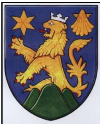
Znak obce Domažlice