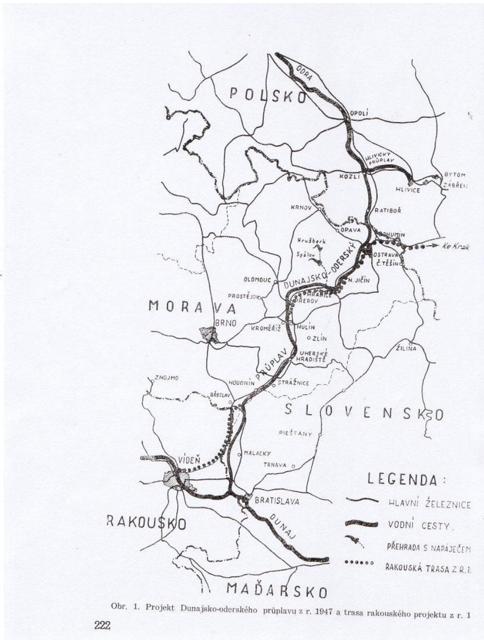
Část mapy kanálu