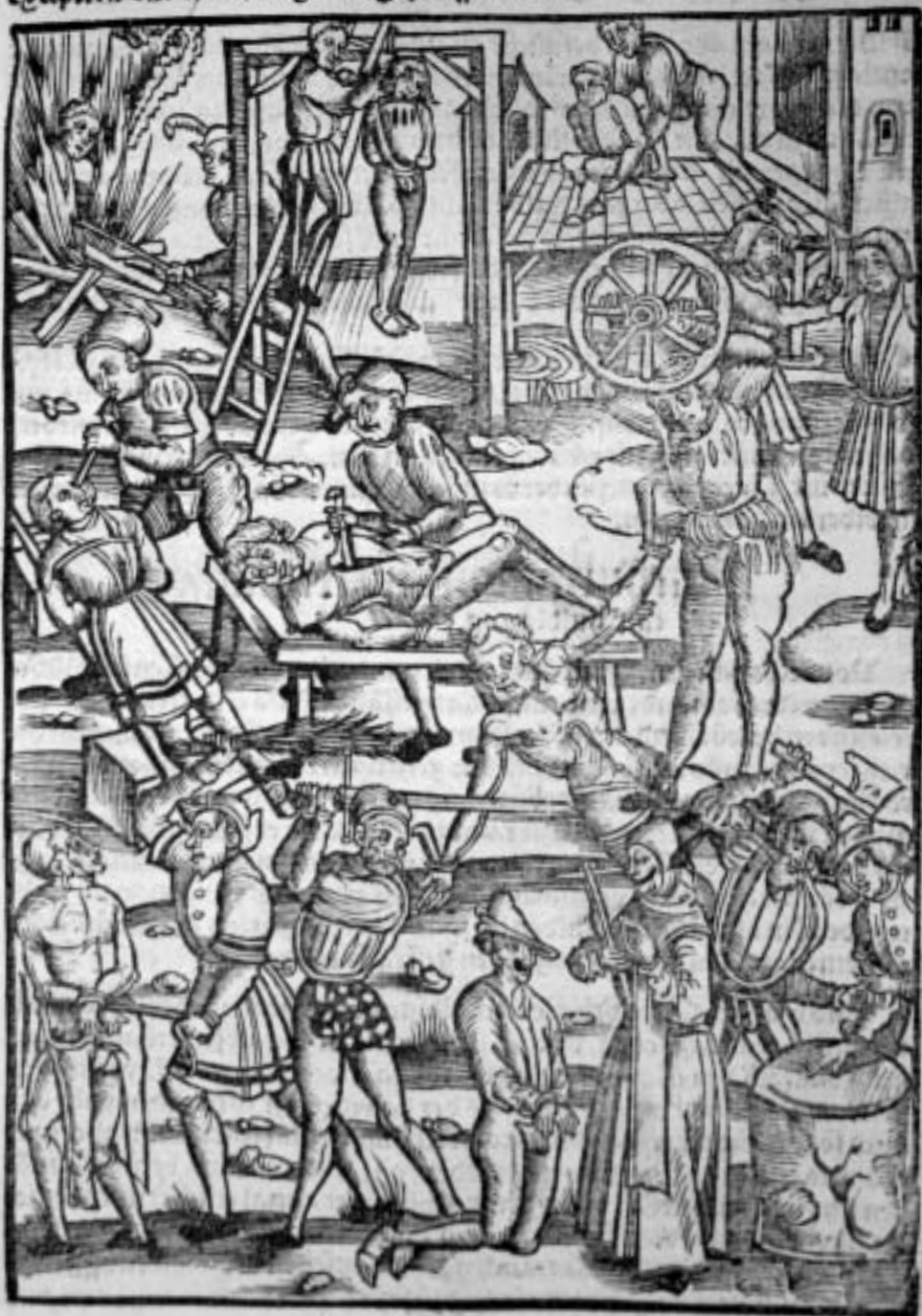
Způsoby mučení a poprav včetně upalování v 16. století

übelthat bewisen/so wirdet doch der dem sy zügemessen ist darumb nit verun leümdt noch anders gestrafft/ dann das er von der selben sachen/ es sey ain an klag/ zeügnuß/ fürderung oder anders auß geschlossen vnd ver worffen/ es ma ge auch der selb ex cipiens ob er solch übelthat nit beweißt/ von seiner rechtlichen ex ception vnd eintred wegen nit gestrafft werden.